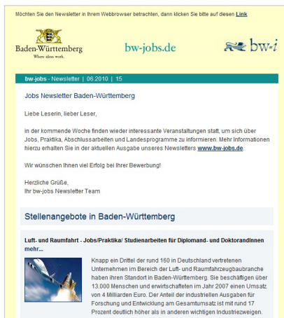
Die Newsletter werden mit individuellen Inhalten in mehreren Sprachen versendet.

Die Empfängerreaktionen und somit der Erfolg der E-Mailings und Newsletter lassen sich im Rahmen der ständigen Erfolgsmessung direkt durch detaillierte Statistiken und Berichte erfassen und auswerten. Die ersten Ergebnisse stehen somit bereits wenige Minuten nach Versand zur Verfügung.